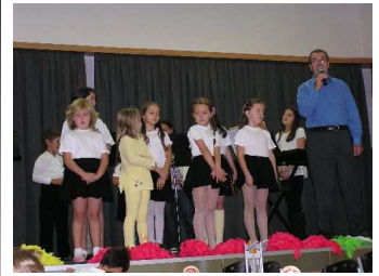
Seniory potěšily svým kulturním vystoupením děti vacovské ZŠ. Za-